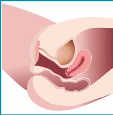
Hüvelyi relaxációs probléma