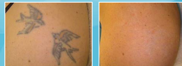
Tattoo-Entfernung mit Q-Switched Nd-YAG Laser Vor- und nach der Behandlung