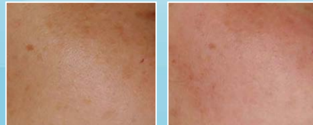
Die Behandlung von Melasma mit QS Nd-YAG Laser Vor- und nach der Behandlung

In der Regel müssen mehrere Sitzungen bei der Behandlung von Melasma durchgeführt werden und nach 4-8 Behandlungen kann ein zufriedenstellendes Ergebnis erreicht werden. Die Behandlung ist non-ablativ, es gibt kein Arbeitsausfall. Fürs Erreichen eines dauerhaften Ergebnis ist ein konsequenter Sonnenschutz mit hohem Lichtschutzfaktor wichtig, damit wird nicht nur die Wirksamkeit der Behandlung gesteigert sondern auch das Erscheinen der neuen Flecken vermindert.