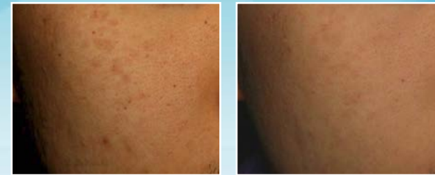
Behandlung von Pigmentflecken mit Q-Switched Nd-YAG Laser • Vor- und nach der Behandlung