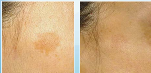
Behandlung vom Lentigo mit Q-Switched Nd-YAG Laser Vor- und nach der Behandlung