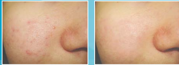
Behandlung von Aknenarben mit Q-Switched Nd-YAG Laser Vor- und nach der Behandlung

Praxis für Chirurgie und ästhetische Chirurgie H-9200 Mosonmagyaróvár, Lucsony u. 1. Tel.: +36 96 576 047, +36 20 93 43 358 info@laserderm.hu WWW.LASERDERM.HU