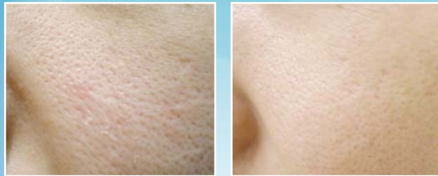
Hautverjüngung mit Q-Switched Nd-YAG Laser Vor- und nach der Behandlung