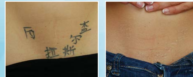
Tattoo-Entfernung Vor und nach der Behandlung