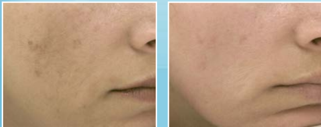
Behandlung von Pigmentveränderungen - Laser-Toning Vor- und nach der Behandlung