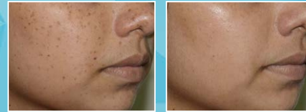
Behandlung von Sommersprossen mit Q-Switched Nd-YAG Laser • Vor- und nach der Behandlung