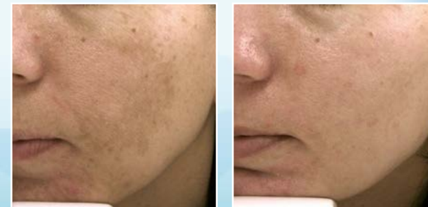
Behandlung vom Melasma mit Q-Switched Nd-YAG Laser Vor- und nach der Behandlung