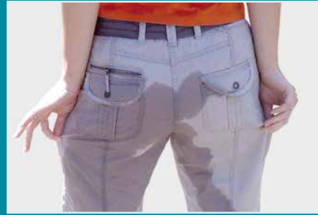
Az inkontinencia nagymértékben befolyásolja az életminőséget