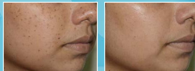
Szeplők kezelése Q-kapcsolt Nd-YAG lézerrel. Kezelés előtt és kezelés után.