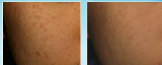
Pigmentfoltok kezelése Q-kapcsolt Nd-YAG lézerrel. Kezelés előtt és kezelés után.