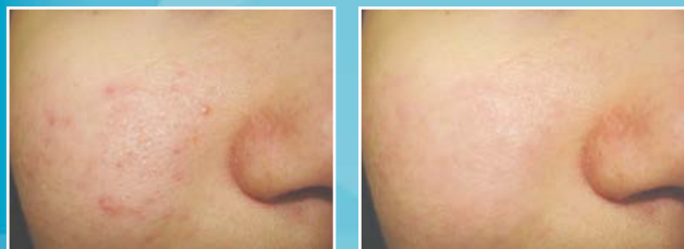
Acne kezelése Q-kapcsolt Nd-YAG lézerrel. Kezelés előtt és kezelés után.

H-9200 Mosonmagyaróvár, Lucsony u. 1. Tel.: +36 96 576 047, +36 20 934 33 58 info@laserderm.hu WWW.LASERDERM.HU