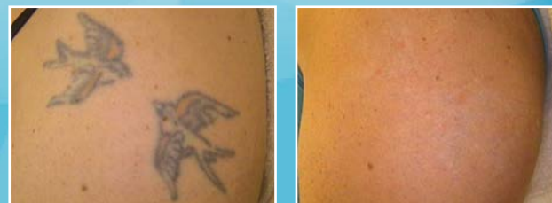
Tetoválások eltávolítása Q-kapcsolt Nd-YAG lézerrel. Kezelés előtt és kezelés után.