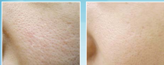
Bőrfiatalítás Q-kapcsolt Nd-YAG lézerrel. Kezelés előtt és kezelés után.